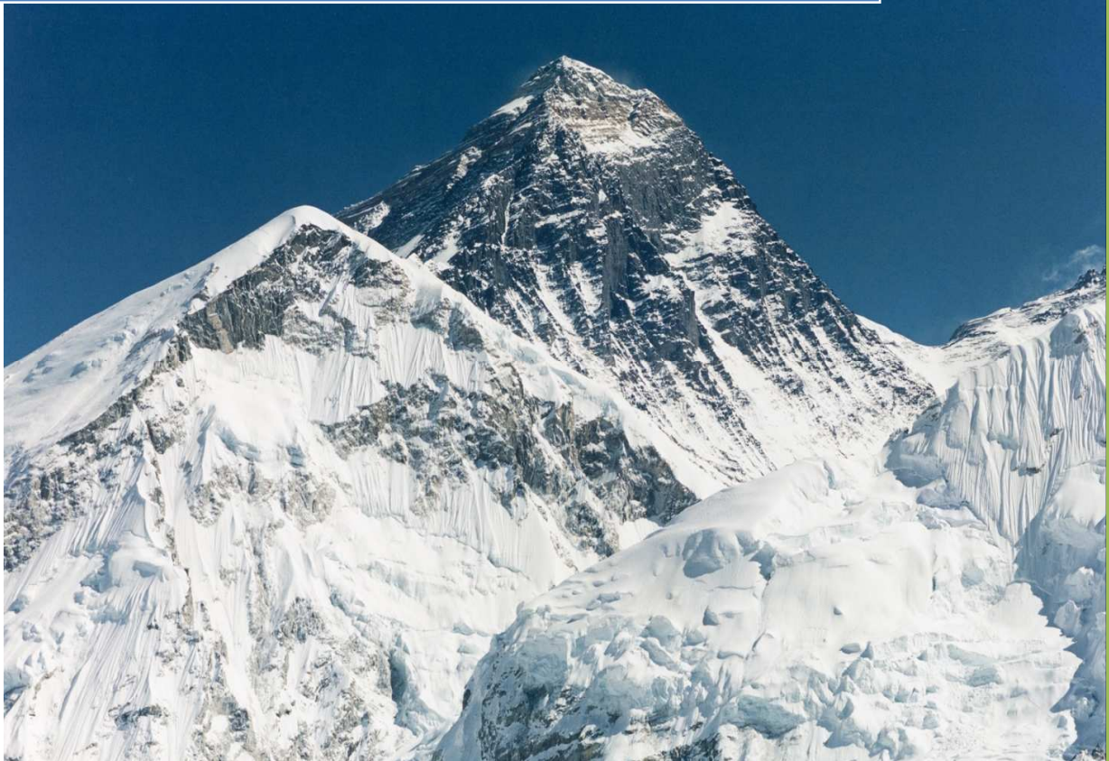
シェルパ（ヒマラヤ登山のガイド）