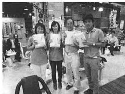
チーム優勝 熱函ゴルフセンター(有)

(主な結果は以下の通りです。敬称略) 《チーム》優勝 熱函ゴルフセンター(有) 2位 雄大(株) 3位 ㈱ワールド技建